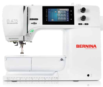
BERNINA 475 QE